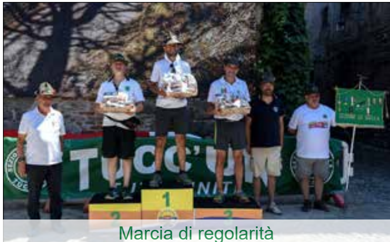
Marcia di regolarità