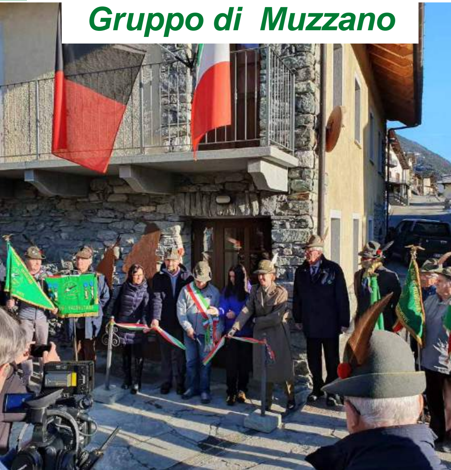
“Hanno partecipato all’inaugurazione del Museo Alpino del Gruppo di Doues (Aosta)”

■ Domenica 29 dicembre, il gruppo alpini di Muzzano, ha partecipato all’inaugurazione del museo Alpino di Doues (Valle d’Aosta). Il gruppo di Doues, gemellato con il gruppo di Muzzano, ha allestito un piccolo spazio espositivo