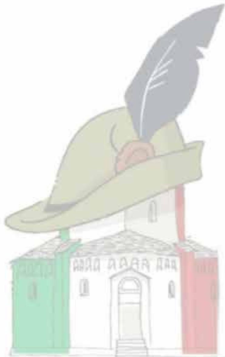
BIELLA - Battistero XI secolo

L e motivazioni "non alpine" che sorreggono questa candidatura sono il voler presentare e far conoscere tutto il nostro territorio, non la sola Città, con l'ambizione che l'iniezione di entusiasmo e partecipazione, che solo quel misto di sacro e profano che un'adunata alpina produce, possa esser volano per una rinascita del nostro amato comprensorio.