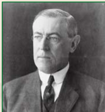
Woodrow Wilson USA