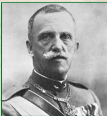
Vittorio Emanuele III

I personaggi che hanno preso parte, direttamente o indirettamente, al Primo Conflitto Mondiale sono stati veramente tanti. I principali protagonisti: