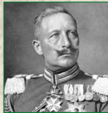
Guglielmo II di Germania