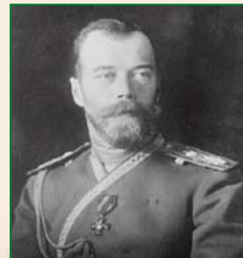
Nicola II di Russia