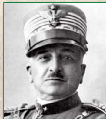
Gen. Luigi Cadorna