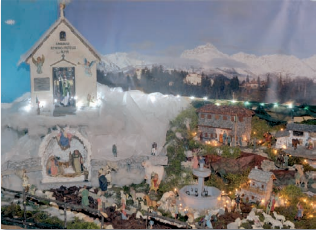
Nella foto: il suggestivo presepe allestito presso la sede sezionale in occasione delle festività natalizie del 2012. Agli autori i più vivi complimenti.