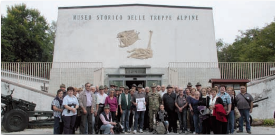
In occasione del 65° di fondazione del Gruppo, gli alpini di Casapinta in gita a Trento, Costalovara e Rovereto.