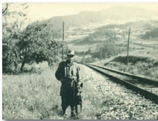
Guardia ferroviaria Brennero