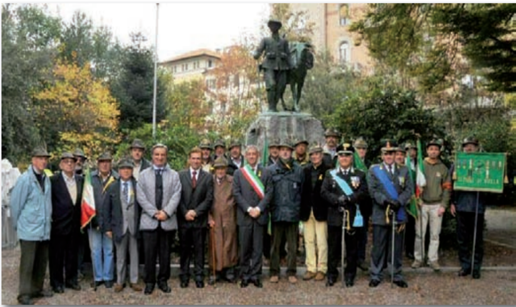
Lunedì 4 novembre, presso il monumento ai Caduti dei giardini Zumaglino di Biella, alla presenza del sindaco e delle autorità civili e militari, si è tenuta la cerimonia commemorativa dell'Unità Nazionale e della giornata delle Forze Armate.