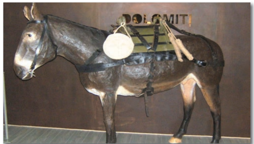
"Ginetta" è arrivata al Museo

Il nostro Museo si è arricchito di un nuovo spazio dedicato alla mascalcia con l'arrivo di un mulo scala 1:1, in vetroresina, battezzata Ginetta in ricordo della mula di Giovanni Cravello in Montenegro nel 1944.