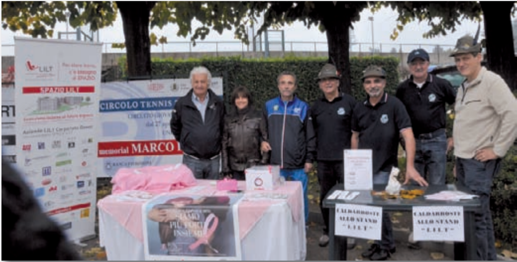
Sabato 19 ottobre presso il "Circolo Tennis Biella" di via Liguria, in occasione del 2° Torneo di tennis "L Double Ar", gli alpini del gruppo Biella Centro Vernato hanno prodotto e distribuito numerose porzioni di caldarroste: l'offerta è stata devoluta alla LILT.