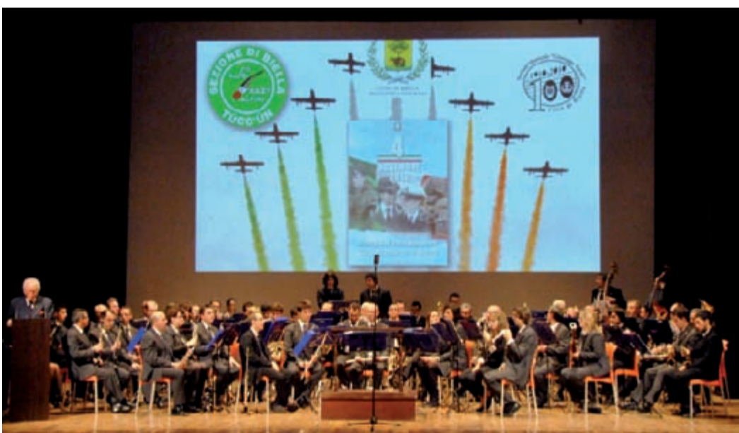
Lunedì 4 novembre, alla presenza delle massime autorità civili e militari, si è svolto al Teatro Sociale di Biella il concerto per le Forze Armate, tenuto dalla banda musicale Giuseppe Verdi di Biella, diretta dal maestro Massimo Folli. Con il supporto video della nostra Sezione