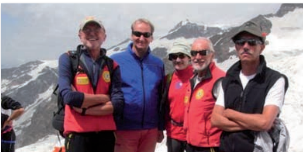
Alla Capanna Gnifetti si è svolta il 3 agosto 2013 l'annuale festa presso la cappella dedicata alla Madonna delle Nevi.