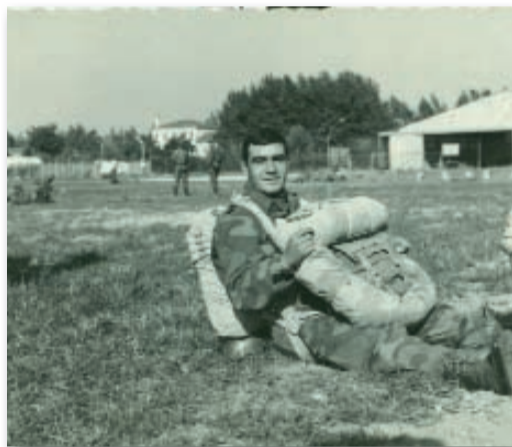
Treviso: attesa del lancio