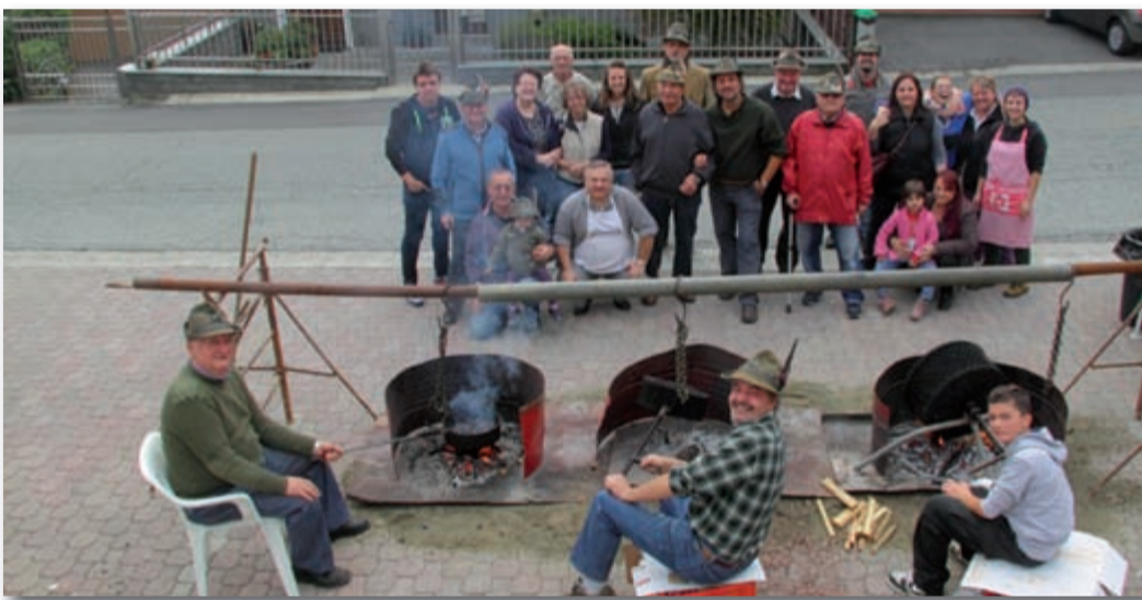
Consueta castagnata e polenta concia, distribuite dal gruppo alpini di Casapinta.