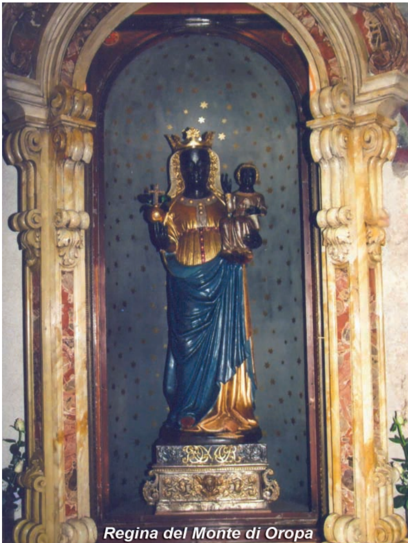
Regina del Monte di Oropa