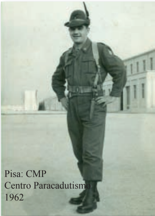
Pisa: CMP Centro Paracadutismo 1962