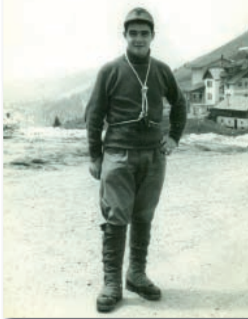
Corso roccia (Passo Sella)