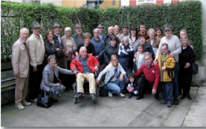
Il gruppo alpini di Pralungo ha accolto, nella propria sede, gli ospiti delle comunità dell'Anffas per la tradizionale castagnata, il 26 ottobre 2013