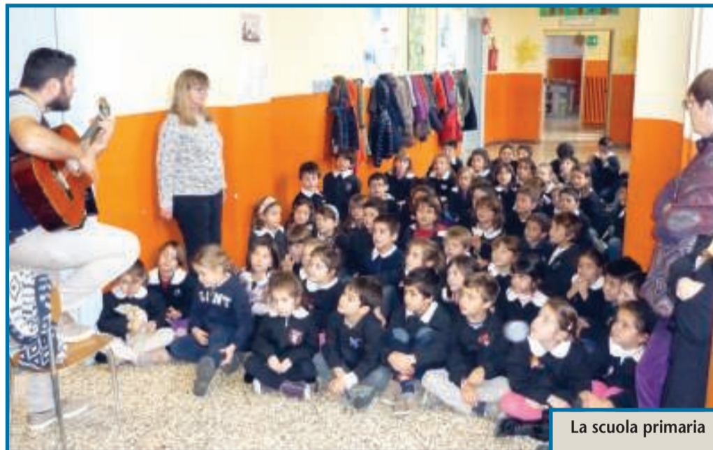
La scuola primaria

Dall'asilo alla scuola primaria che ha festeggiato il Natale, come è ormai tradizione, accogliendo i nonni della casa di riposo. Nell'incontro, avvenu-