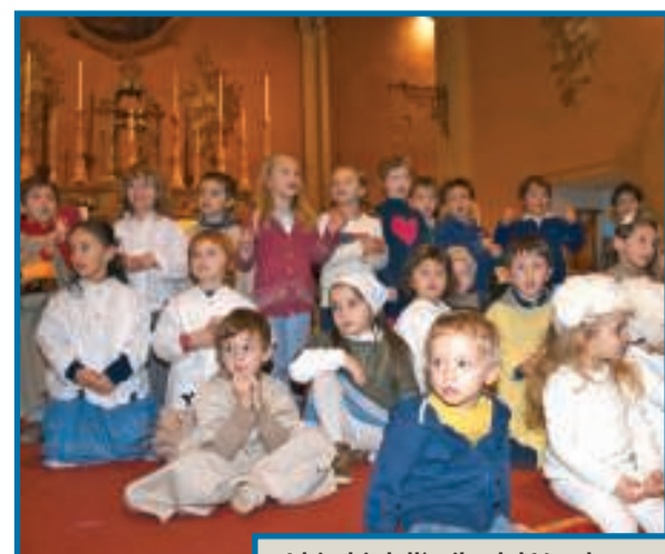
I bimbi dell'asilo del Vandorno