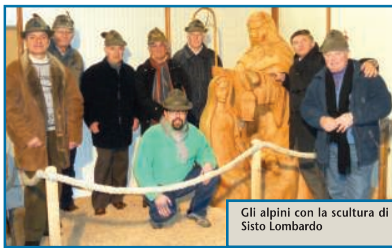
Gli alpini con la scultura di Sisto Lombardo