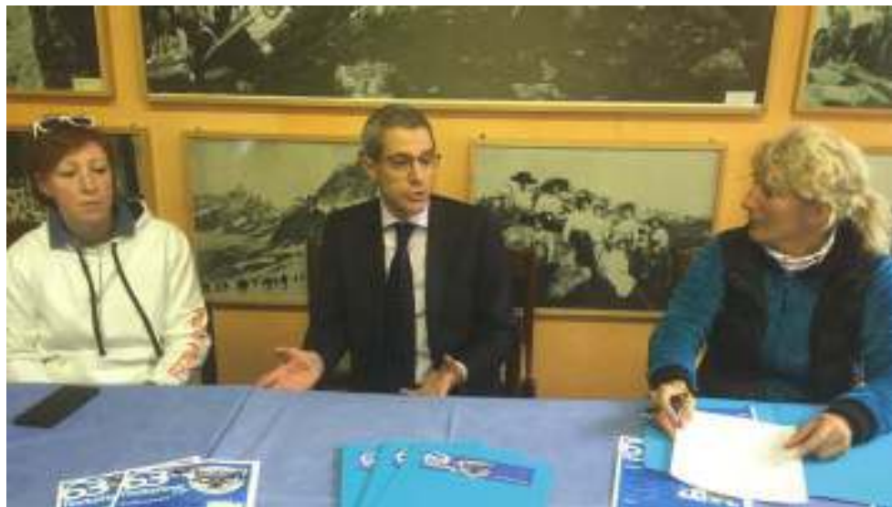
Un momento della presentazione della festa della neve organizzata dalla società Pietro Micca

La seconda puntata invece si terrà il 18 febbraio nella località piemontese di Bardonecchia. Dopo l'esperienza decennale di Sestriere la festa della neve fa ritorno sulle montagne olimpiche di Torino 2006. Giunti a destinazione i ragazzi avranno modo di dedicarsi all'attività prescelta: l'immane skipass, il pattinaggio, la ciaspolata, l'ingresso al funpark (la