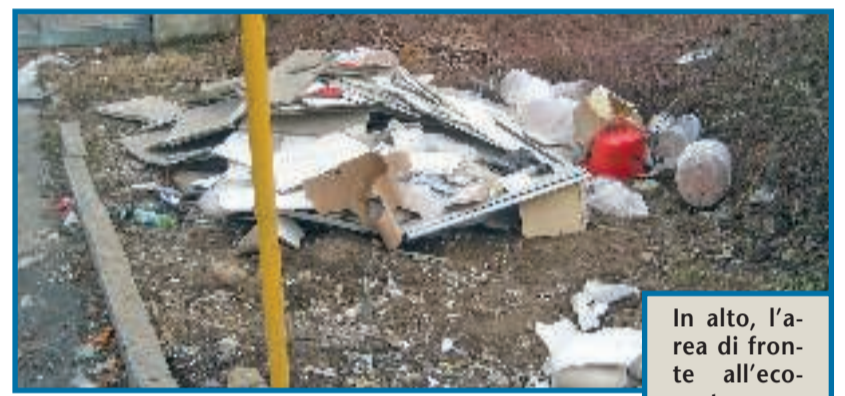
In alto, l'area di fronte all'ecocentro sporcata dal vandalo. A sinistra, la stessa ripulita dopo il riconoscimento con la telecamera