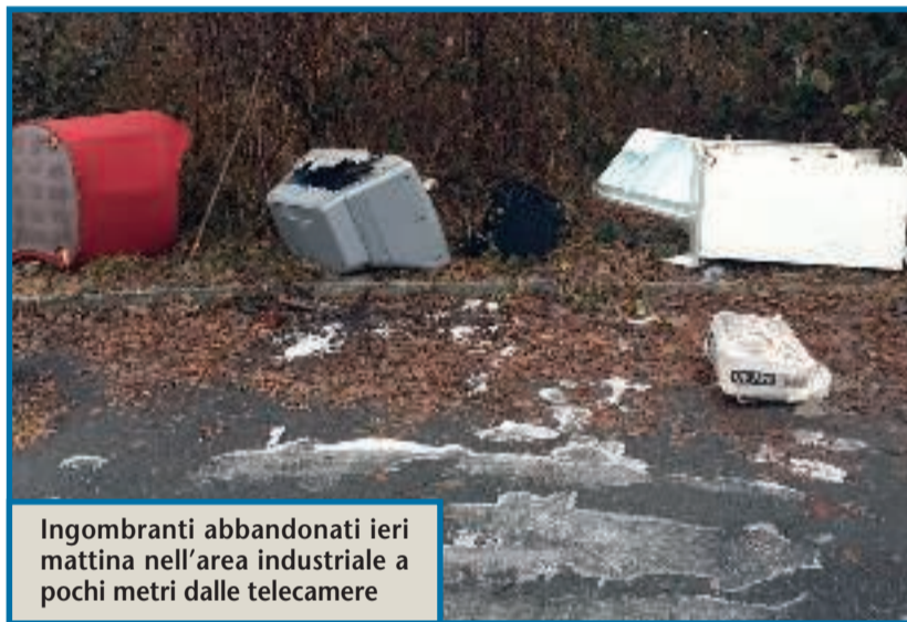
Ingombranti abbandonati ieri mattina nell'area industriale a pochi metri dalle telecamere

Una vittoria che però non ha lasciato il tempo di festeggiare. Perché, all'indomani della soluzione di questo caso, subito un nuovo problema si è presentato. I vandali hanno pensato bene di spostare alcuni panettoni in cemento, che delimitano un'area a pochi metri dalla zona controllata