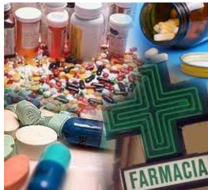
Farmacie biellesi sul piede di guerra contro l'Asl