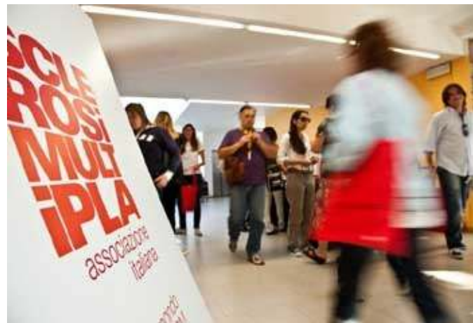
Grande successo per la lotteria organizzata dall'Aism

sole 20.336; 35° Macchina da caffè 14.331; 36° Macchina da caffè 18.135; 37° Cesto gastronomico 14.563; 38° Buono lucidatura auto 5.438; 39° Penna stilografica 20.142; 40° Servizio caffè x 6 persone 6.072; 41° Servizio caffè x 6 persone 15.143; 42° Servizio caffè x 6 persone 29.188; 43° Quadro porcellana/oro 27.017; 44° Set da bagno 1.206; 45° Set da bagno 21.997; 46° Set da bagno 4.574; 47° Set da bagno 966; 48° Parure lenzuola matrimoniali 15.580; 49° Completo di 4 piumoni letto 21.108; 50° Servizio the in ceramica 28.472.