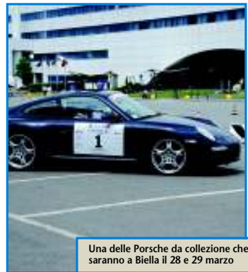
Una delle Porsche da collezione che saranno a Biella il 28 e 29 marzo

in tutti i settori della vita civile, quanto per la spesso sottovalutata capacità di "fare sistema" delle persone che lo animano. Una festa fortemente voluta dal Porsche Club Piemonte e Valle d'Aosta che vogliamo sia dedicata a tutta la città» hanno spiegato. Per Biella la manifestazione sarà davvero un'occasione per mostrarsi nella sua veste migliore a un pubblico di visitatori "di qualità" e che rappresentano per molti versi un bacino di