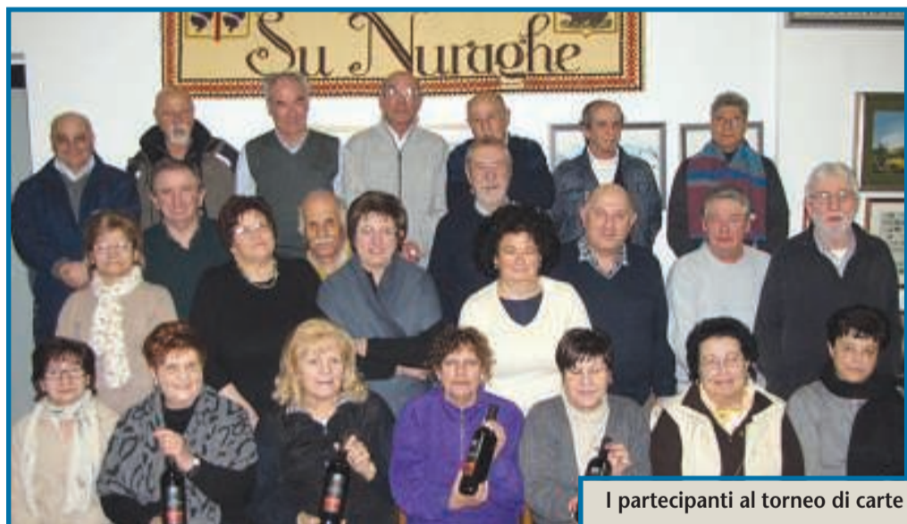
I partecipanti al torneo di carte