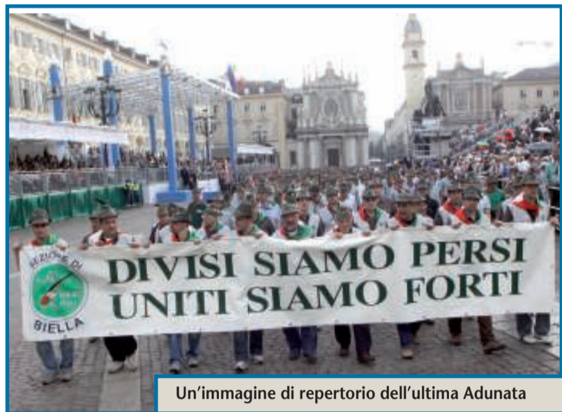
Un'immagine di repertorio dell'ultima Adunata

Grande fermento presso la sede dell'Associazione Nazionale Alpini di Biella, in via Ferruccio Nazionale, ove fervono i preparativi in vista dell'85ª Adunata Nazionale che si svolgerà il prossimo fine settimana a Bolzano. Non è la prima volta che il capoluogo trentino ospita l'Adunata delle "penne nere". Il precedente risale al 1949, tempi evidentemente diversi e lontani. Il tema dell'Adunata di quest'anno sarà "I valori dei padri: amicizia, fratellanza, responsabilità per una Patria migliore". Valori forti evidentemente, ai quali in momenti difficili come questi è doveroso rifarsi per ritrovare un'identità, la giusta coesione e la volontà di ripartire. In tal senso, risuona con forza anche il messaggio del presidente nazionale dell'Ana, il biellese Corrado Perona, che recentemente su "L'Alpino" scriveva: "Quest'anno l'incontro riveste una particolare importanza perché Bolzano è la sede del Comando delle Truppe Alpine, nel 140° anniversario di fondazione di un Corpo che si è distinto per abnegazione, servizio e sacrificio. Non c'è retorica nelle nostre Adunate. Non c'è retorica nello sventolare il Tricolore. Se qualcuno frantendesse, sbaglierebbe. Così deve essere. E così sarà. Nel rispetto della gente che ci ospita e dell'armonia dell'ambiente». Come di consueto, molta attesa circonda anche la preparazione degli striscioni che le "penne nere" biellesi, sempre numerosissime alle Adunate nazionali, re-