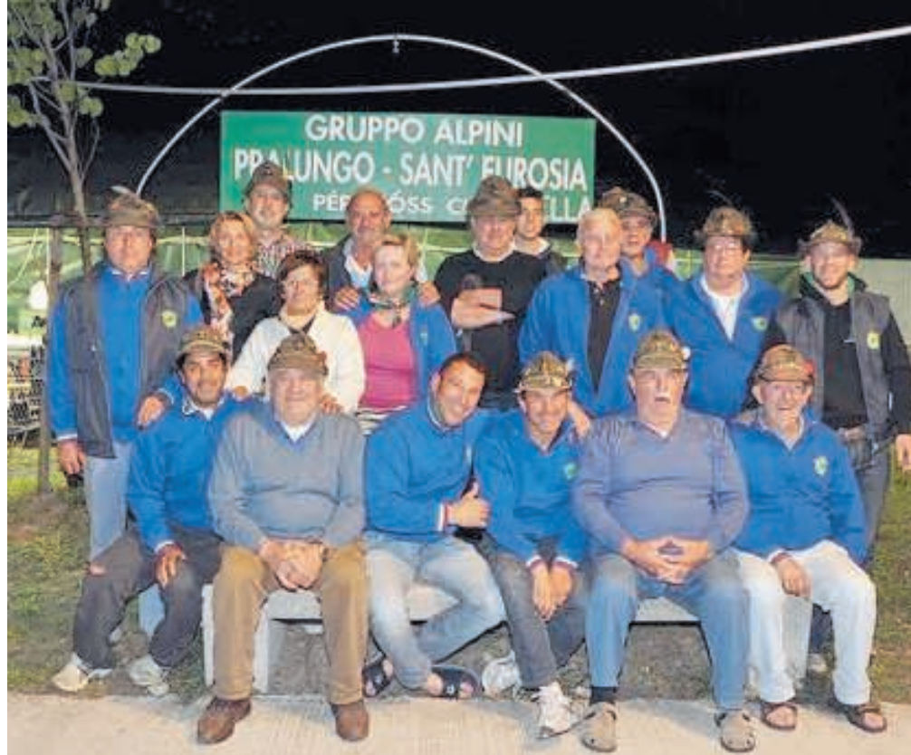
Alpini biellesi che partecipano all'adunata nazionale di Pordenone

Infine il motto della 87° adunata che motiverà le penne nere è "Alpini: esempio per l'Italia".