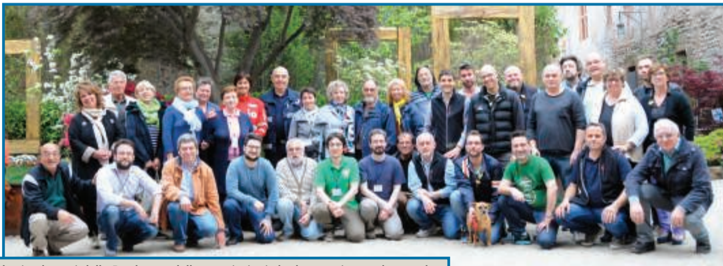
In alto i volontari della Pro loco e delle associazioni che hanno aiutato durante la manifestazione. Sotto: a sinistra alcune socie del Garden Club Biella presenti all'evento e a destra Candeloincoro durante un'esibizione

■ "Candelo in fiore" si è concluso con un record di presenze: nei 16 giorni di durata della manifestazione sono stati emessi 30.494 biglietti. «Una cifra mai raggiunta» commenta il sindaco Mariella Biollino. «Nell'ultima edizione infatti, due anni fa, erano stati venduti circa 24 mila ingressi. Questo successo è dovuto alle operazioni di promozione che la Pro loco ha messo in atto sui social network e alla campagna nazionale fatta dal Comune nell'ambito dei Borghi più belli: sono stati trasmessi due servizi sul Ricetto dalle televisioni nazionali e dalla radio, che certamente hanno contribuito a diffondere la notizia della manifestazione anche fuori da Biella. Ringrazio la Pro loco e i florovivaisti» conclude Biollino. Che fornisce alcuni dati relativi alla comunicazione: la pagina Facebook del Ricetto, nelle due settimane della manifestazione, ha avuto una copertura di 150mila persone. Quella relativa a Candelo in fiore è stata di 466mila. Soddisfatto Stefano Leardi, presidente della Pro loco: «Siamo stati aiutati dal bel tempo, e siamo molto contenti del risultato. I riscontri di chi ha partecipato sono stati per la maggior parte positivi, e anche l'introduzione della biglietteria online e dell'annullo elettronico ha velocizzato le procedure all'ingresso. Molti turisti sono attivati da tutto il nord Italia e ne hanno approfittato per visitare altri luoghi caratteristici del Biellese».