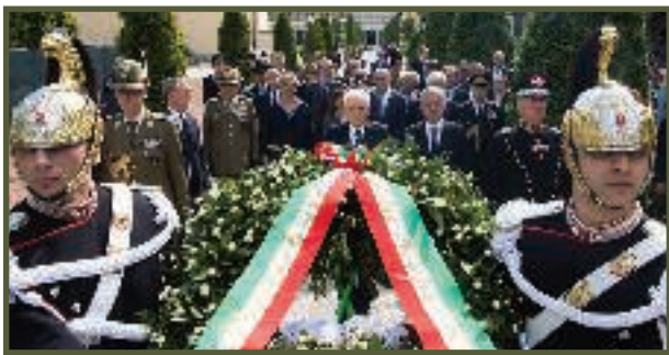
Le immagini delle cerimonie con il Capo di Stato