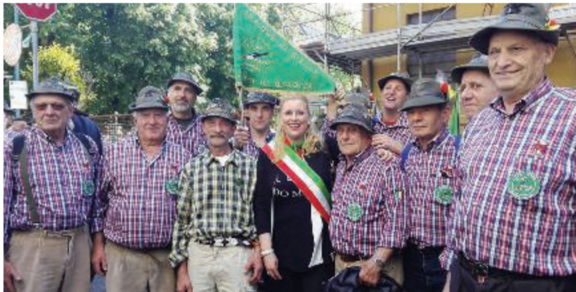
Il Gruppo di Graglia ha partecipato, con un nutrito numero di alpini e di rappresentanti del comune, al raduno alpino di Asti domenica 15 maggio 2016