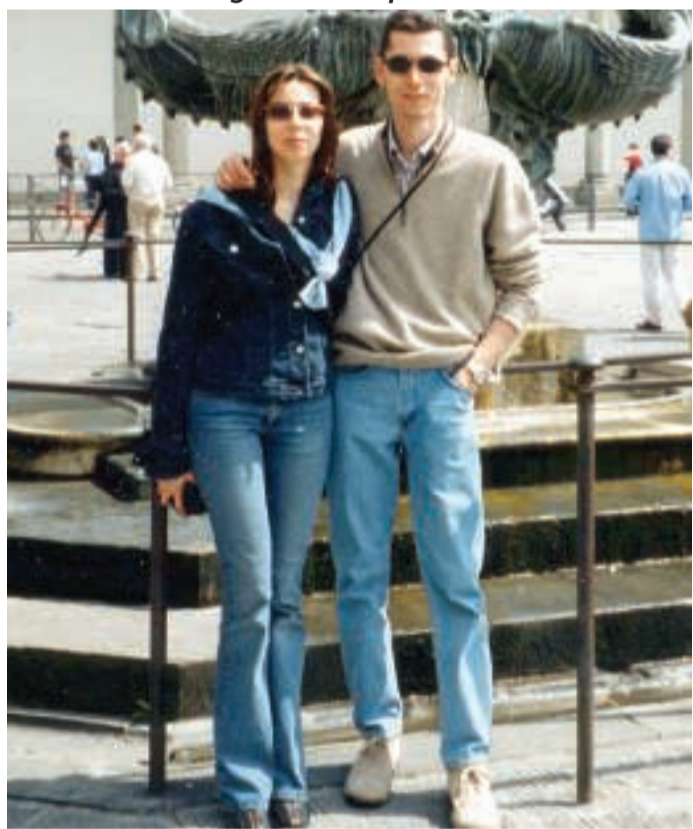
Con tanto affetto. I genitori