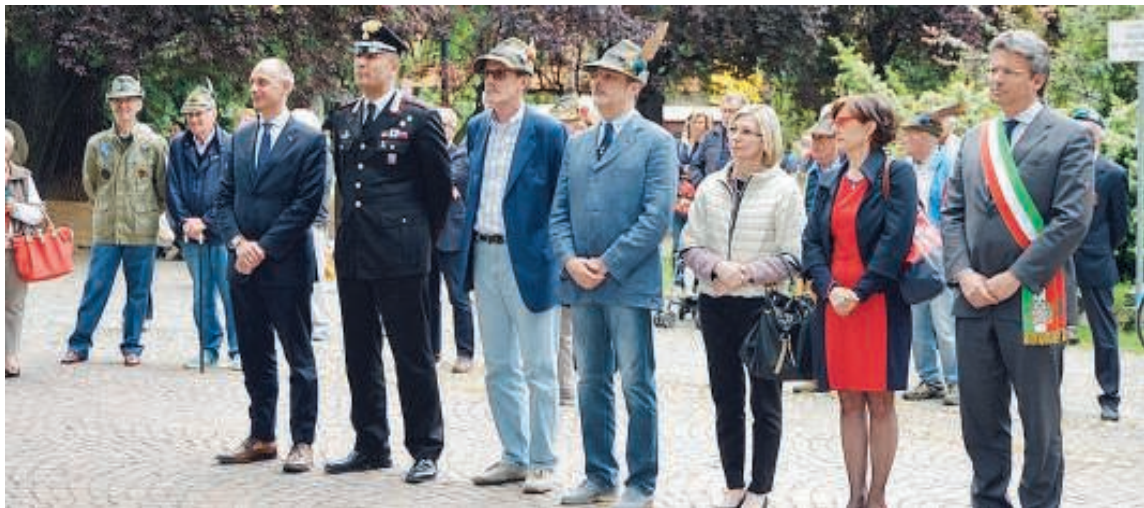
La commemorazione ai Giardini del centenario della guerra

BIELLA (ces) Sabato gli oltre settanta gruppi alpini di Biella hanno ricordato l'ultimo giorno di pace di cent'anni fa con cerimonie di omaggio ai caduti in tutti questi paesi dove è presente