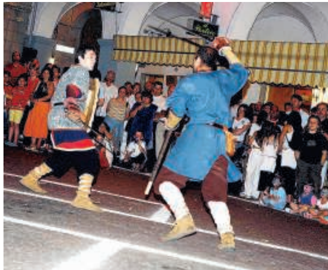
Una foto della passata edizione

tornei di cavalieri combattenti, mercati medioevali e tante sorprese». Una gustosa cena itinerante dai sapori piemontesi allietterà i palati di dame e cavalieri in una spettacolare e suggestiva cornice notturna. Sarà allestito un vero e proprio percorso dove gustare antipasti, primi, secondi e dolci. Bisognerà però acquistare tutto tramite i "testoni" del Principato di Masserano. Saranno disponibili nelle postazioni di cambio e saranno la moneta ufficiale del borgo dando diritto all'acquisto di uno o più piatti durante l'intera serata. Nelle piazze inoltre non mancheranno gli spettacoli. Un momento delle passate edizioni