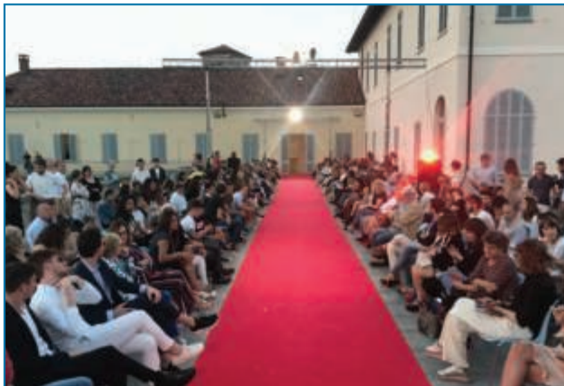
I giardini di Palazzo Gromo Losa hanno ospitato la sfilata: una cornice affascinante per le modelle che hanno percorso il red carpet