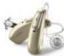
Phonak Audeo™ Marvel Amore al primo suono