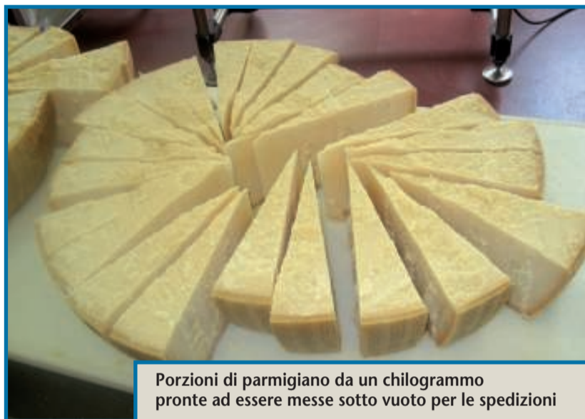
Porzioni di parmigiano da un chilogrammo pronte ad essere messe sotto vuoto per le spedizioni