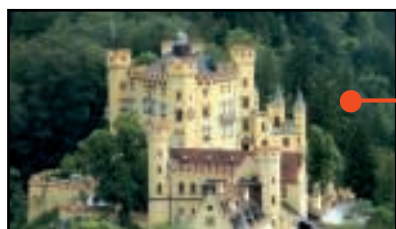
I CASTELLI della BAVIERA