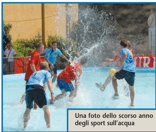
Una foto dello scorso anno degli sport sull'acqua

La piscina è una struttura di gomma di 24x12 metri e viene riempita con 30/40 centimetri di acqua per un totale di circa 60 metri cubi. La manifestazione attira ogni anno tantissimi giovani e non solo: infatti quest'anno per la prima volta si sfideranno in due squadre diverse i padri e i figli. «ormai per alcuni siamo diventati una tradizione di famiglia! Lo spirito è molto gioioso e non è strano che le squadre si presentino in campo con travestimenti di diverso genere: sub, infermieri, banda bassotti. Ma appena iniziano