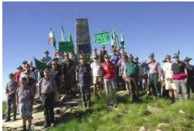
Alcune immagini dei precedenti raduni sezionali organizzati dagli alpini di Biella al Monte Camino

BIELLA (ces) Domani, domenica 21 luglio, si terrà come ogni anno il tradizionale raduno sezionale organizzato dagli alpini di Biella al Monte Camino.