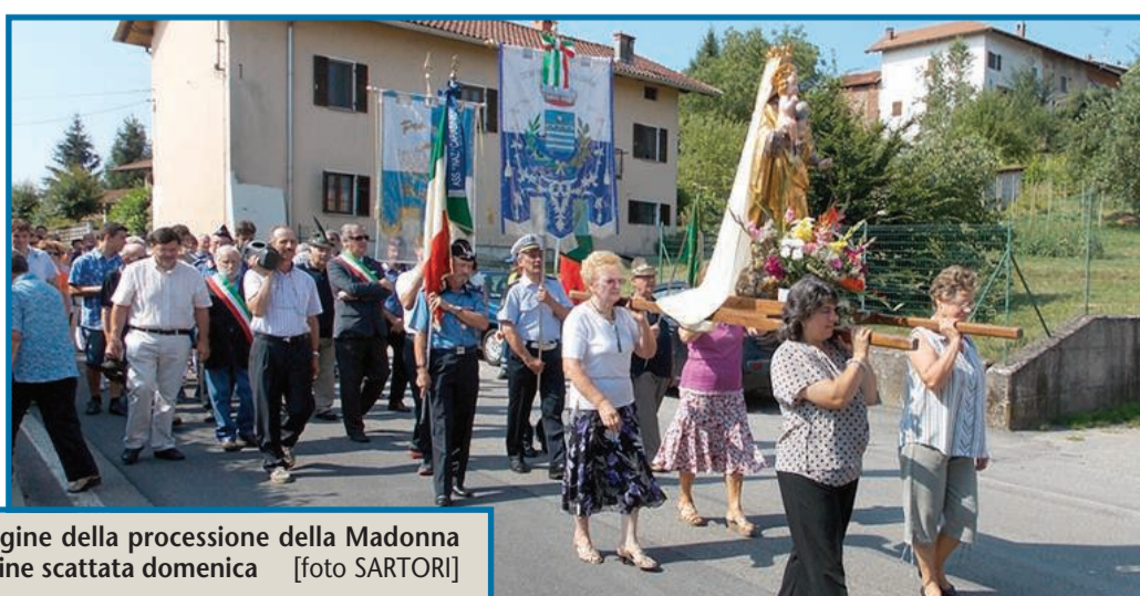
Un'immagine della processione della Madonna del Carmine scattata domenica