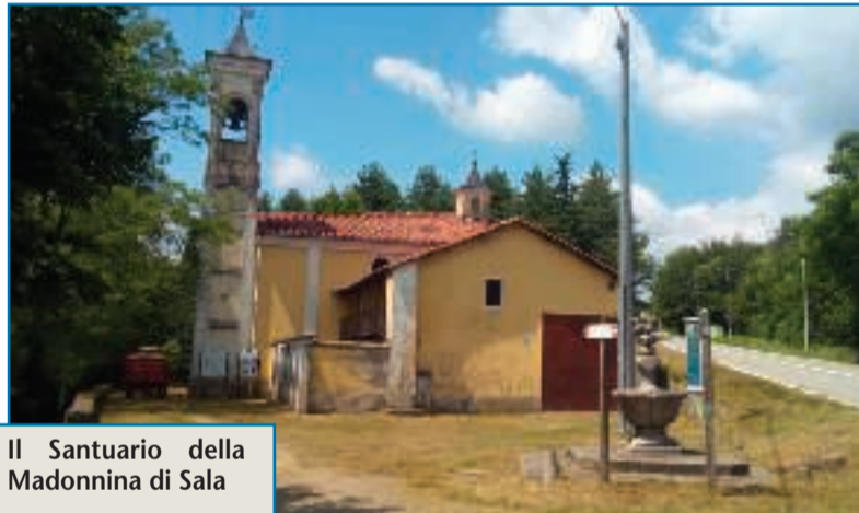
Il Santuario della Madonnina di Sala