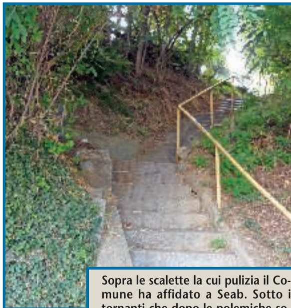
Sopra le scalette la cui pulizia il Comune ha affidato a Seab. Sotto i tornanti che dopo le polemiche sono stati ripuliti