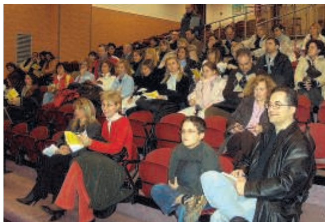
Saranno in tanti i cittadini coinvolti grazie alle Consulte