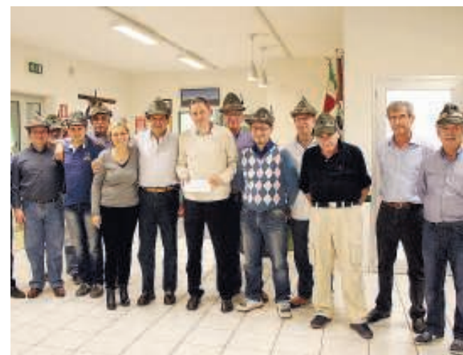
Una rappresentativa del gruppo degli alpini di Ponderano