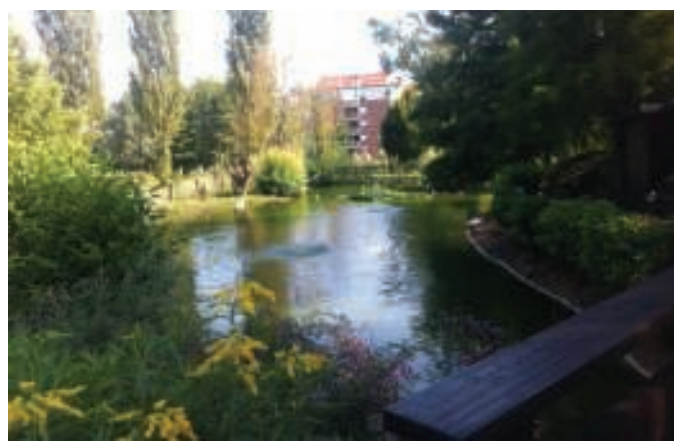
Due viste del laghetto di Chiavazza. Qui sotto a destra i volontari

attrattiva della zona, soprattutto per i bambini. Oggi siamo arrivati alla conclusione dei lavori, anche se la manutenzione dev'essere costante e quotidiana. Togliamo le foglie, abbiamo studiato un sistema per il ricambio dell'acqua, abbiamo creato delle casette per gli animali». E grazie alla collaborazione con il vivaio Lanari di Valdengo sono riusciti anche a sistemare nuove piantumazioni. Il risultato del lavoro