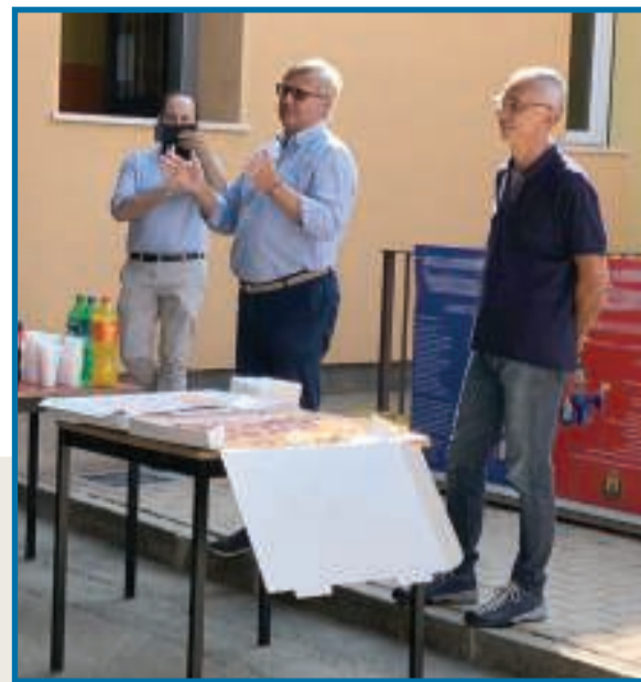
Il saluto degli amministratori all'inizio della scuola. I ragazzi hanno trovato sul banco il regalino offerto dall'amministrazione, poi pizzata per tutti