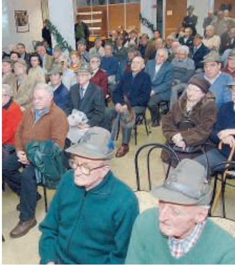
Alpini in festa nel fine settimana

Non mancherà la lotteria degli alpini, il cui ricavato serve per migliorare la sede: l'estrazione dei premi avverrà alle 15 di domani, il più fortunato si aggiudicherà addirittura un viaggio a Roma.