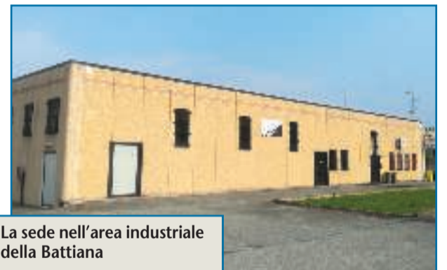
La sede nell'area industriale della Battiana