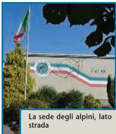
La sede degli alpini, lato strada