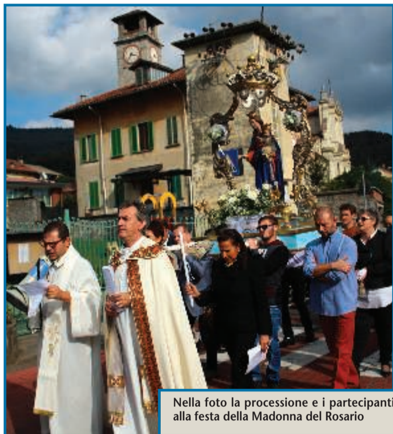
Nella foto la processione e i partecipanti alla festa della Madonna del Rosario