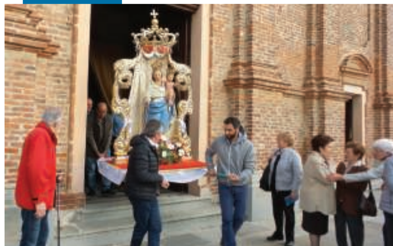
PROCESSIONE PER LA FESTA DELLA MADONNA DEL ROSARIO. Domenica scorsa, la comunità parrocchiale di Zubiena ha ricordato la Madonna del Rosario con la Messa, concelebrata alle 15.30 dal