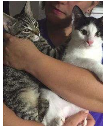
gara, lo spettacolo "Best in Show" durante il quale questi splendidi

Nel pomeriggio, sia di oggi che di domani, vi sarà una vera e propria