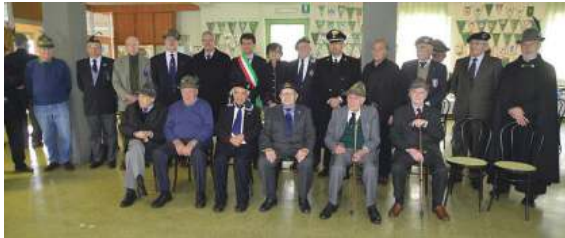
Gli ultimi reduci biellesi della Seconda Guerra Mondiale fotografati nella sede sezionale degli alpini in occasione della cerimonia a loro dedicata