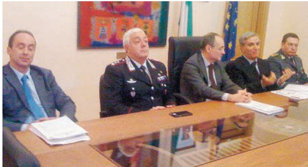
Un momento durante la conferenza stampa che si è tenuta ieri pomeriggio in Prefettura

Entrando nel merito del progetto, i giovani che sono coinvolti direttamente, oppure vengono a conoscenza o ancora, assistono a situazioni legate al fenomeno del bullismo o allo spaccio di sostanze stupefacenti all'interno o nelle immediate vicinanze dell'istituto sco-