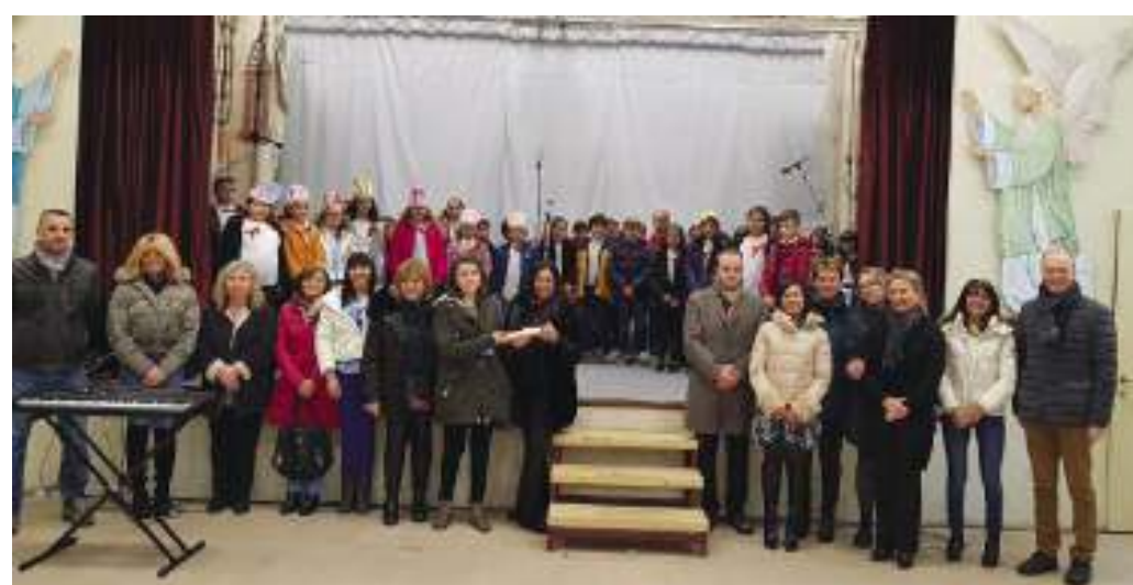
Bambini, insegnanti e genitori immortalati domenica al Mercatino Degli angeli di Sordevolo