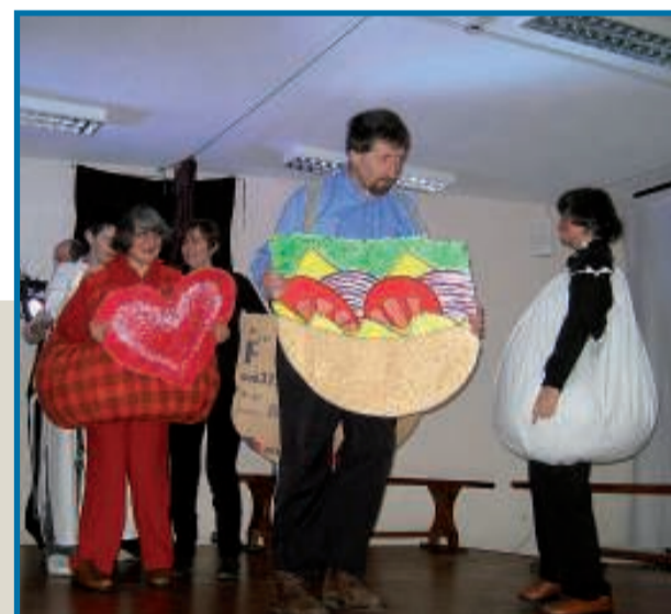
Due immagini dello spettacolo natalizio messo in scena dai ragazzi del Giovanni XXIII nel pomeriggio di sabato 17 dicembre