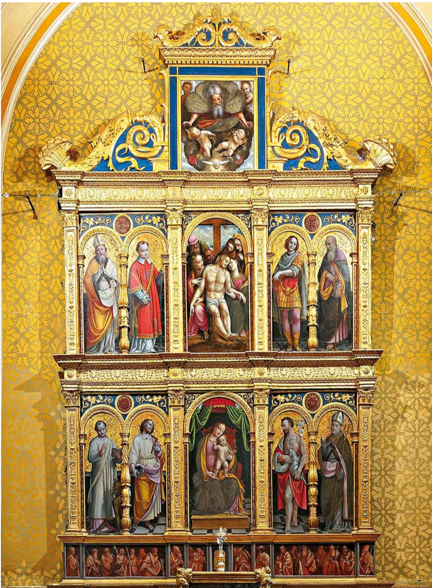
Polittico di Bernardino Lanino - 1565 Chiesa parrocchiale di Campiglia Cervo

Sede Sezionale: Via Ferruccio Nazionale, 5 - 13900 BIELLA - tel. 015406112 - fax. 0158401493 - http://www.anabiella.it - E-mail: biella@ana.it Direzione e Redazione Tücc' Ün: Via Ferruccio Nazionale, 5 - 13900 BIELLA - E-mail: tuccun@tuccun.it - direttore@tuccun.it