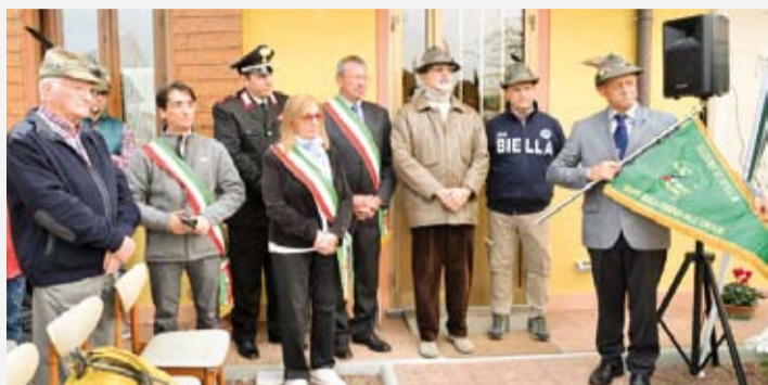
Sabato 21 ottobre 2017, gli alpini del gruppo di Bioglio -Ternengo - Valle San Nicolao, dopo la benedizione, hanno festeggiato il nuovo Gagliardetto.