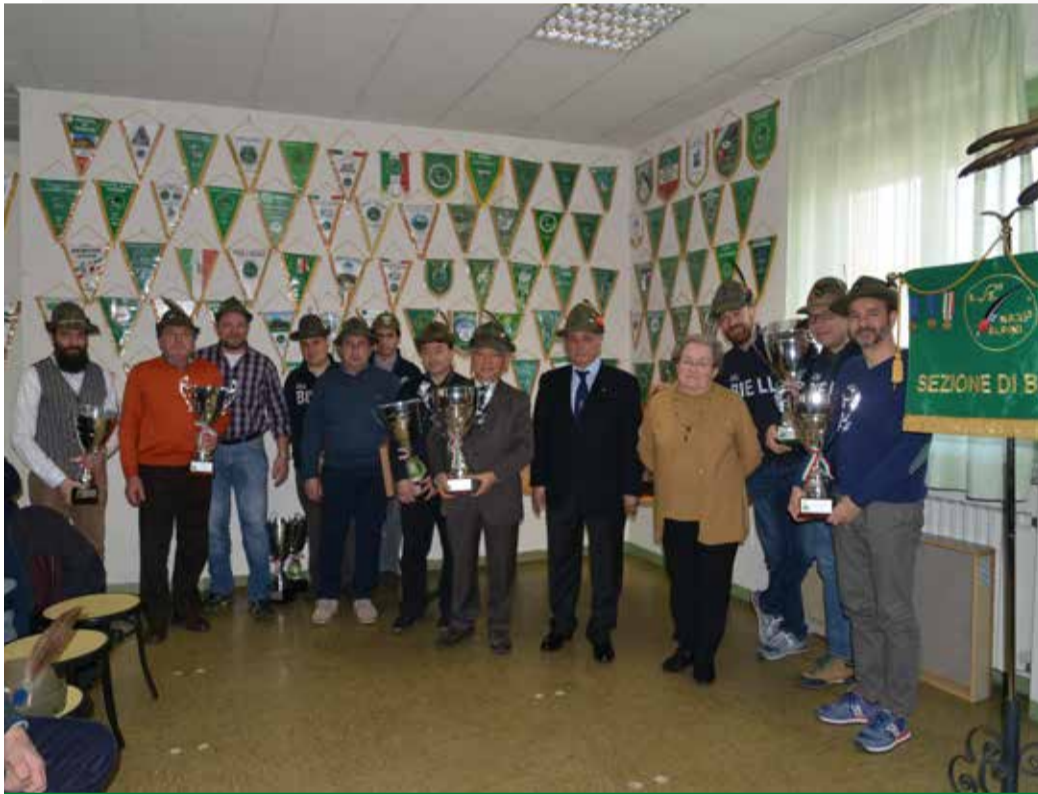
Premiazione atleti dello sport 2018