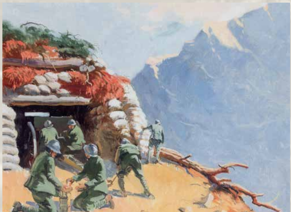
Italo Brass - "Batteria in Carnia" da "La Grande Guerra, racconti pittorici" di Italo Brass