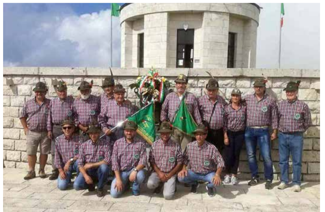
Domenica 16 settembre I Gagliardetti dei gruppi Cossato/ Quaregna e Mottalciata al Sacrario di Cima Grappa