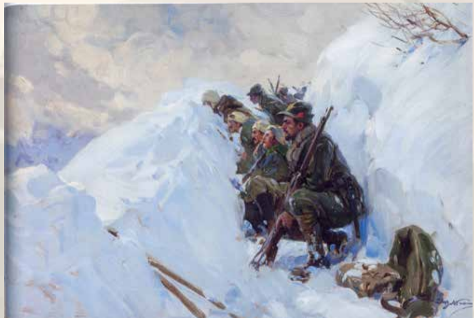
Achille Beltrame - "Alpini sul nevaio" da "La Grande Guerra, racconti pittorici" di Italo Brass