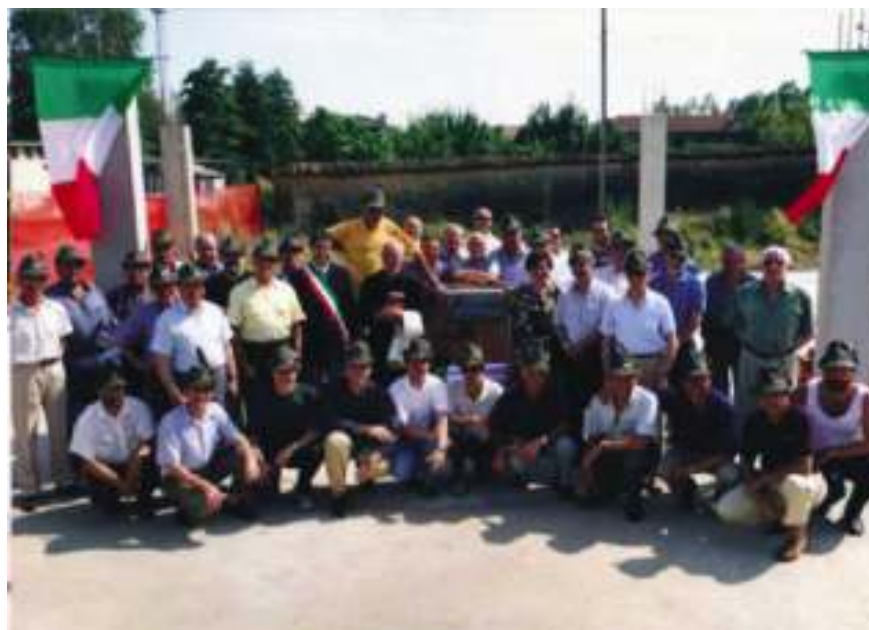
Due immagini storiche che testimoniano il momento della posa della prima pietra in quella che poi diventò la sede degli Alpini