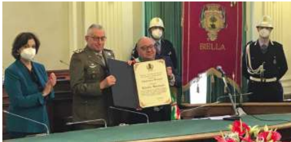
La cerimonia della consegna della cittadinanza onoraria al generale Claudio Graziano si è svolta giovedì mattina a Palazzo Oropa

Dopo la frequenza del Corso di Stato Maggiore terminato nell'87, è stato trasferito allo Stato Maggiore dell'Esercito, dove ha ricoperto l'incarico di addetto all'ufficio Programmi di approvvigionamento e quindi promosso Tenente Colonnello e destinato all'ufficio del Capo di Stato Maggiore dell'Esercito.