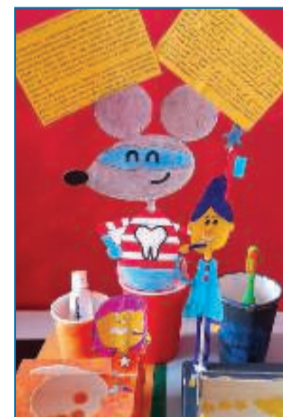
Nelle foto alcuni dei lavori preparati in classe dai bimbi aiutati dalle loro insegnanti e a lato una delle "prove pratiche" di igiene della bocca

costruiti appositamente da lei, atti al raggiungimento dei macro obiettivi del concorso: igiene orale, cura della bocca, corretta alimentazione e l'importanza del dentista. Un grazie di cuore a tutti i nostri bambini, i quali hanno partecipato con interesse ed entusiasmo classificandosi tra i primi 20 in tutta Italia, vincendo un tablet per la scuola e 68 kit ricchi di prodotti per l'igiene orale Mentadent da portare alle proprie famiglie. E per concludere non ci resta che scrivere "Grazie Mentadent".