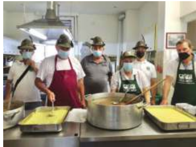
Alcuni dei volontari del gruppo Cossato-Quaregna

Ormai sono due anni che viviamo senza organizzare la