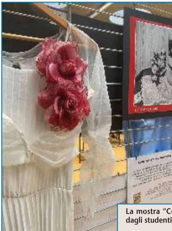
La mostra "Com'eri vestita?" allestita dagli studenti del Liceo del Cossatese