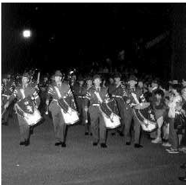
La Fanfara della Brigata Taurinense in una delle sue esibizioni biellesi