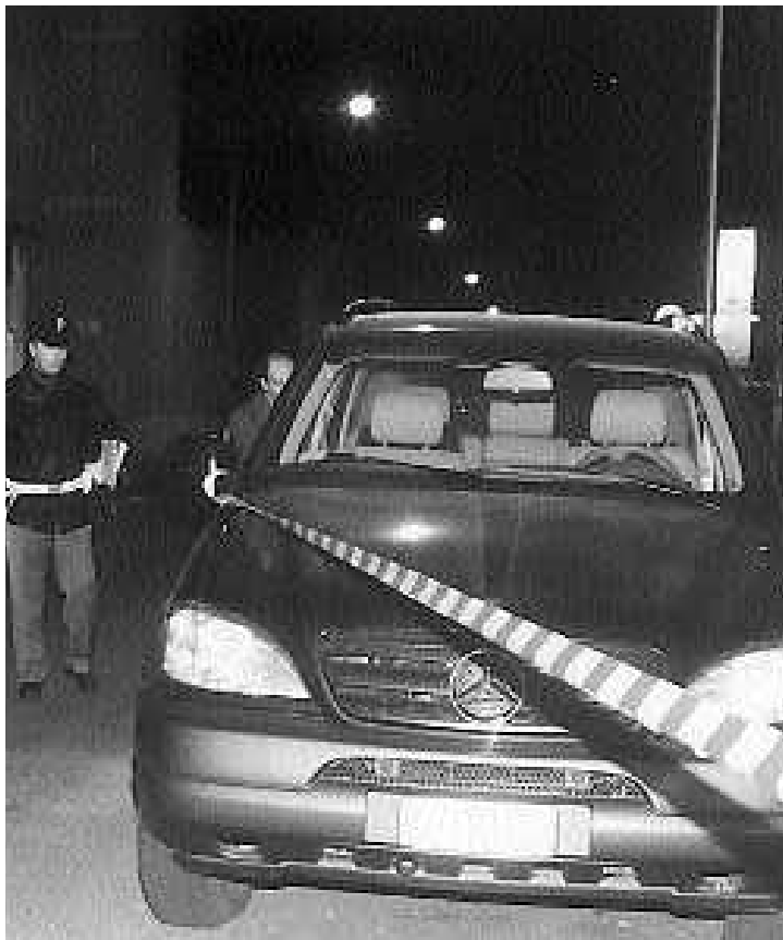
L'auto è stata solo danneggiata dallo scoppio. Paura nel quartiere [CERETTI]