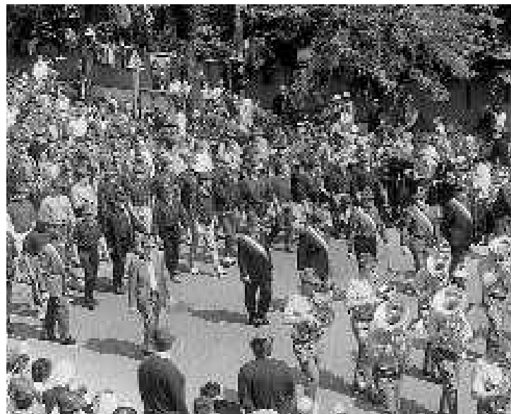
Le penne nere sfilano a Biella? La decisione spetterà all'Ana [COMBA]