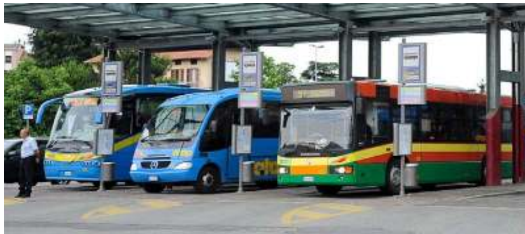
Sono già 500 le firme per salvare il bus che collega Biella a Milano