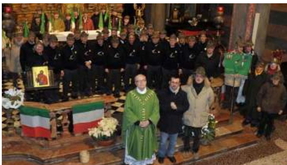
LA RIEVOCAZIONE Il 70° di Nikolajewka

Il 70° della battaglia Nikolajewka nella palude russa nel 1942 è stato ricordato al Piazzo per iniziativa del